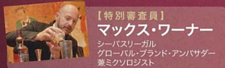
【特別審査員】 マックス・ワーナー シーバスリーガル グローバル・ブランド・アンバサダー 兼ミクソロジスト